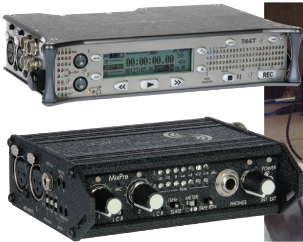
Рекордер 744T и аудиомикшер MixPre

Драст также встроил в свой аудиоконкомплекс компактный внестудийный микшер Sound Devices MixPre. «Если мы записыва-