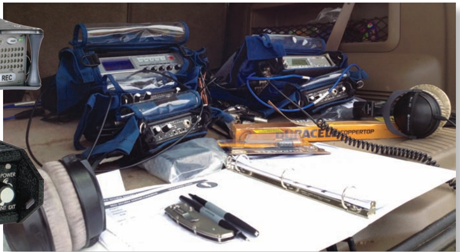
Оборудование Sound Devices в багажнике автомобиля

Внимание Red Storm Entertainment на оборудование Sound Devices обратил эксперт в области записи звуков оружия Чарльз Мэйнз (Charles Maynes), и вот компания использовала рекордер 744T для высококачественной записи звука для своих хитов – игр Rainbow Six и Ghost Recon, включая наиболее свежий релиз Ghost Recon: Future Soldier.