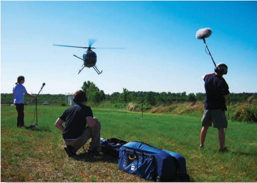
Ведется запись звука вертолета